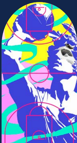
« Altius »